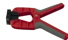
GMZ 38* Art.-Nr. 605783 Holzfeuchtemesszange, für Messung an Funieren und dünnen Hölzern (bis ca. 10 mm)