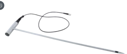
GSF 40 (67 cm) Art.-Nr. 601316 Materialfeuchte-Einstechfühler, (ohne Temperatursensor) zur Messung in gepressten Ballen in 60 cm Tiefe, inkl. 1 m Anschlusskabel. Geeignet für: Gepresste Heu- und Strohballen, Getreide

*Messkabel GMK 38 erforderlich für GHE 91, GSE 91, GSG 91, GST 15B / 25B / 40B, GBSK 91, GBSL 91, GEF 38, GSP 91, GMZ 38