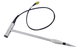
GSF 50TF (110 cm) Art.-Nr. 601312 GSF 50TFK (43 cm) Art.-Nr. 601313 Materialfeuchte-Einstechfühler, mit Temperatursensor zur Messung in Messtiefen bis 40 cm bzw. 107 cm, inkl. 1 m Anschlusskabel Geeignet für: Hackschnitzel, Holzwolle, Holzspäne, Stroh, Heu, Getreide, Sägemehl, etc.