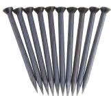
GST 91/40 Art.-Nr. 601275 Stahlstifte 10 Stahlstifte, 40 mm lang, Ø 2,5 mm, in Plastikdose