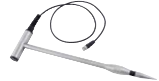
GSF 50 (110 cm) Art.-Nr. 601305 GSF 50K (43 cm) Art.-Nr. 601308 Materialfeuchte-Einstechfühler, (ohne Temperatursensor) zur Messung in Messtiefen bis 40 cm bzw. 107 cm, inkl. 1 m Anschlusskabel. Geeignet für: Hackschnitzel, Holzwolle, Holzspäne, Stroh, Heu, Getreide, Sägemehl, etc.